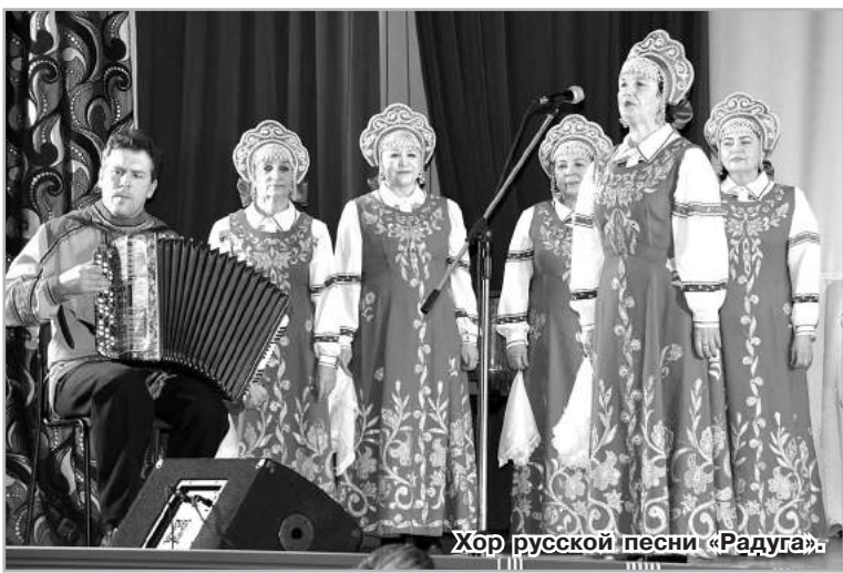
Хор русской песни «Радуга».