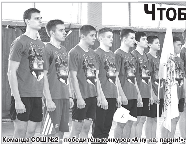
Команда СОШ №2 - победитель конкурса «А ну-ка, парни!»

Ещё учась в школе, многие юноши задумываются о том, что им предстоит служить в армии, защищать своё Отечество. А потому уделяют большое внимание развитию своих физических способностей, тренируются, укрепляют здоровье. Проверить себя, свою силу, ловкость, смекалку, выносливость они могут, приняв участие в городском конкурсе «А ну-ка, парни», который традиционно проводится в рамках мероприятий, посвящённых Дню защитника Отечества в целях повышения интереса молодежи к военно-прикладным видам спорта, развития физических и волевых качеств молодежи, готовности к защите Отечества.